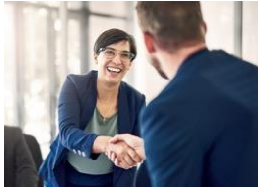
Compañía de Relaciones