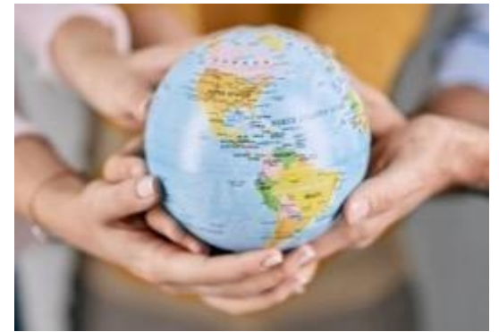
Presencia nacional e internacional