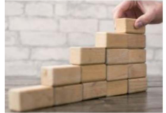
Crecimiento histórico del Capital Contable superior al 20% anual

Estamos convencidos que la mejor forma de hacer negocios es a través de relaciones.