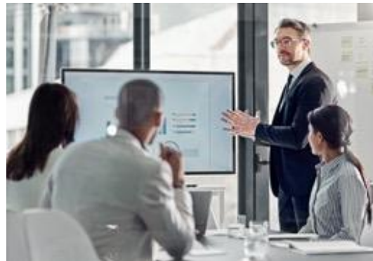
Desarrollo basado en la estrategia de negocio original

Facilitamos el logro de las metas personales y empresariales de los líderes de México, para impulsar el desarrollo de nuestro país.